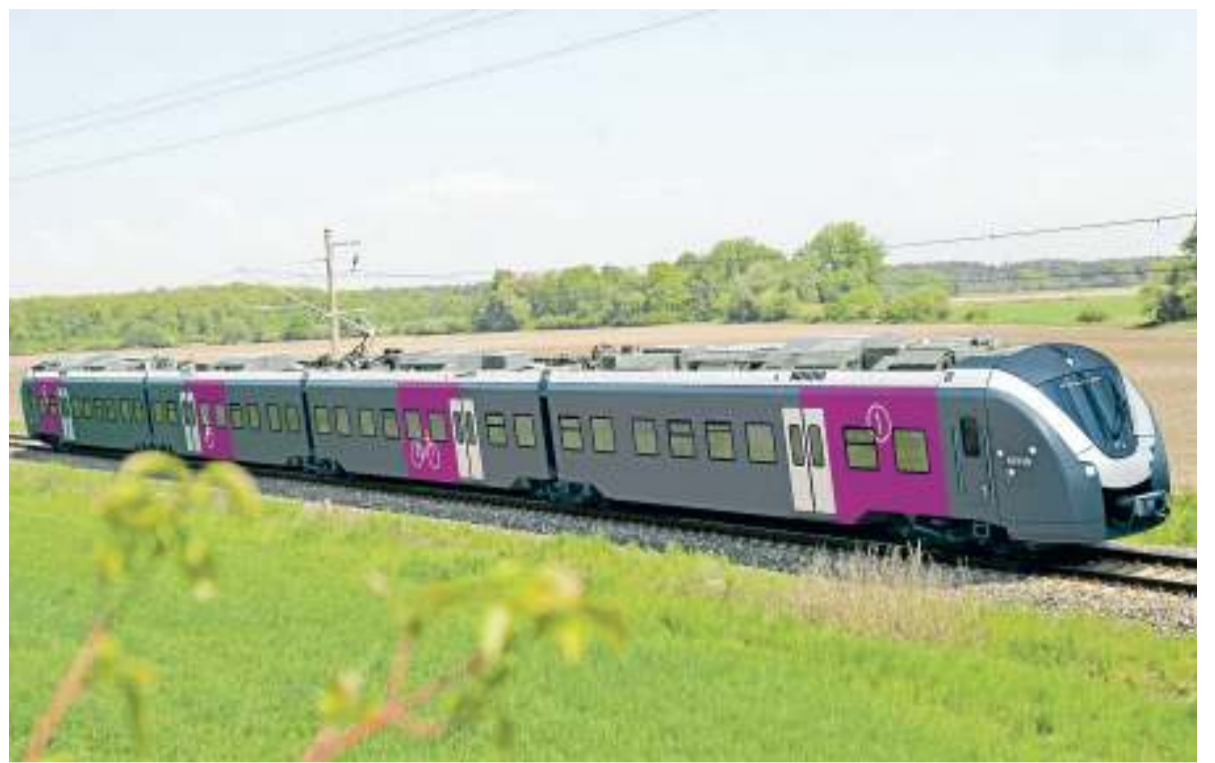
Ab Dezember 2015 fahren die Elektrozüge „Enno“ von Wolfsburg nach Braunschweig und Hannover. Die Stadtverwaltung möchte gern eine halbstündliche Taktung auf diesen Strecken.