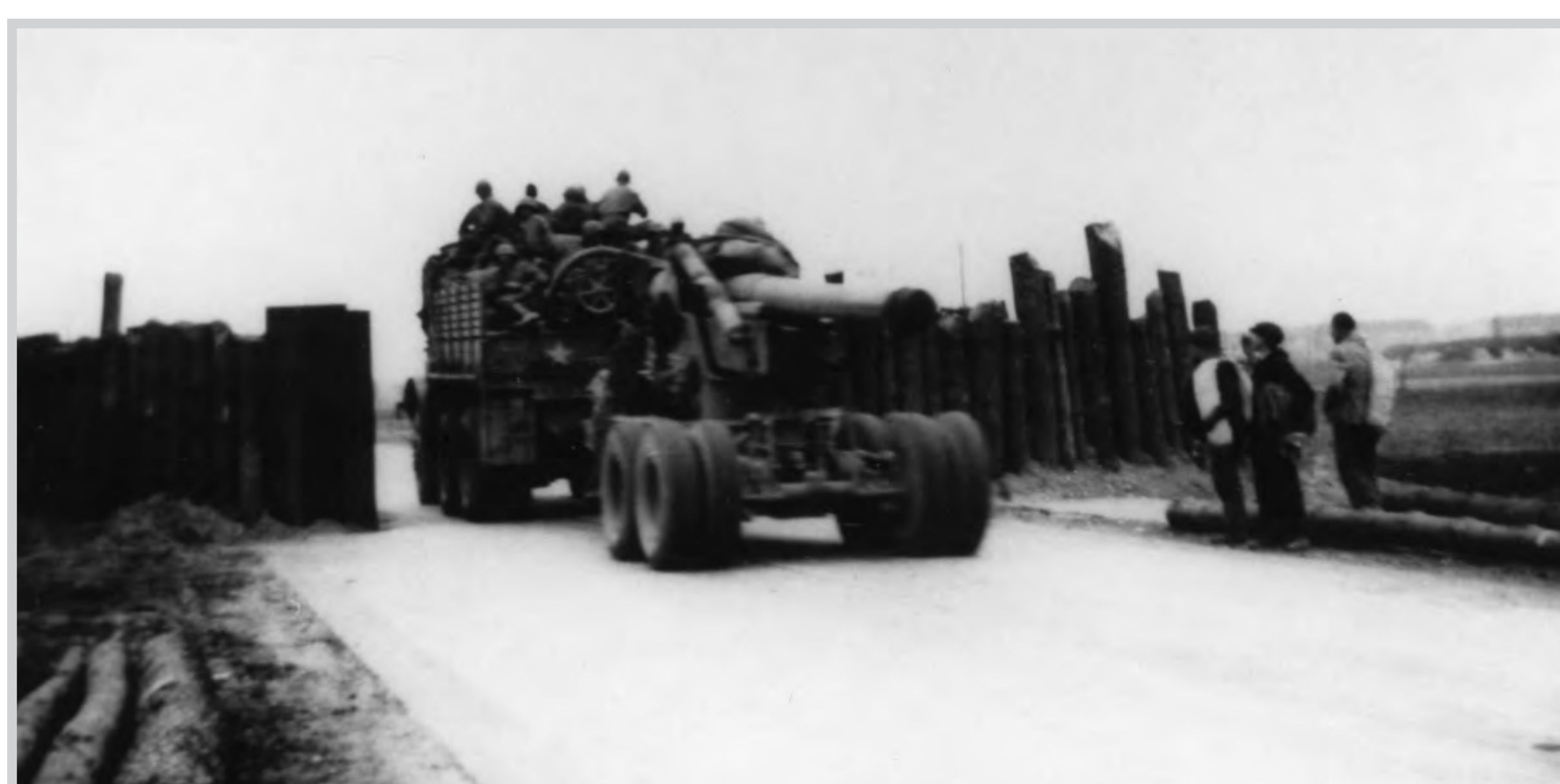
Amerikanisches Militär rückt in Wolfsburg ein

machtssoldaten und auch Zwangsarbeiter befanden sich unter den Opfern. In den in der „Stadt des Kdf-Wagens“ Halt machenden Lazarettzügen erlagen verwundete Soldaten ihren Verletzungen und wurden ebenfalls hier bestattet.