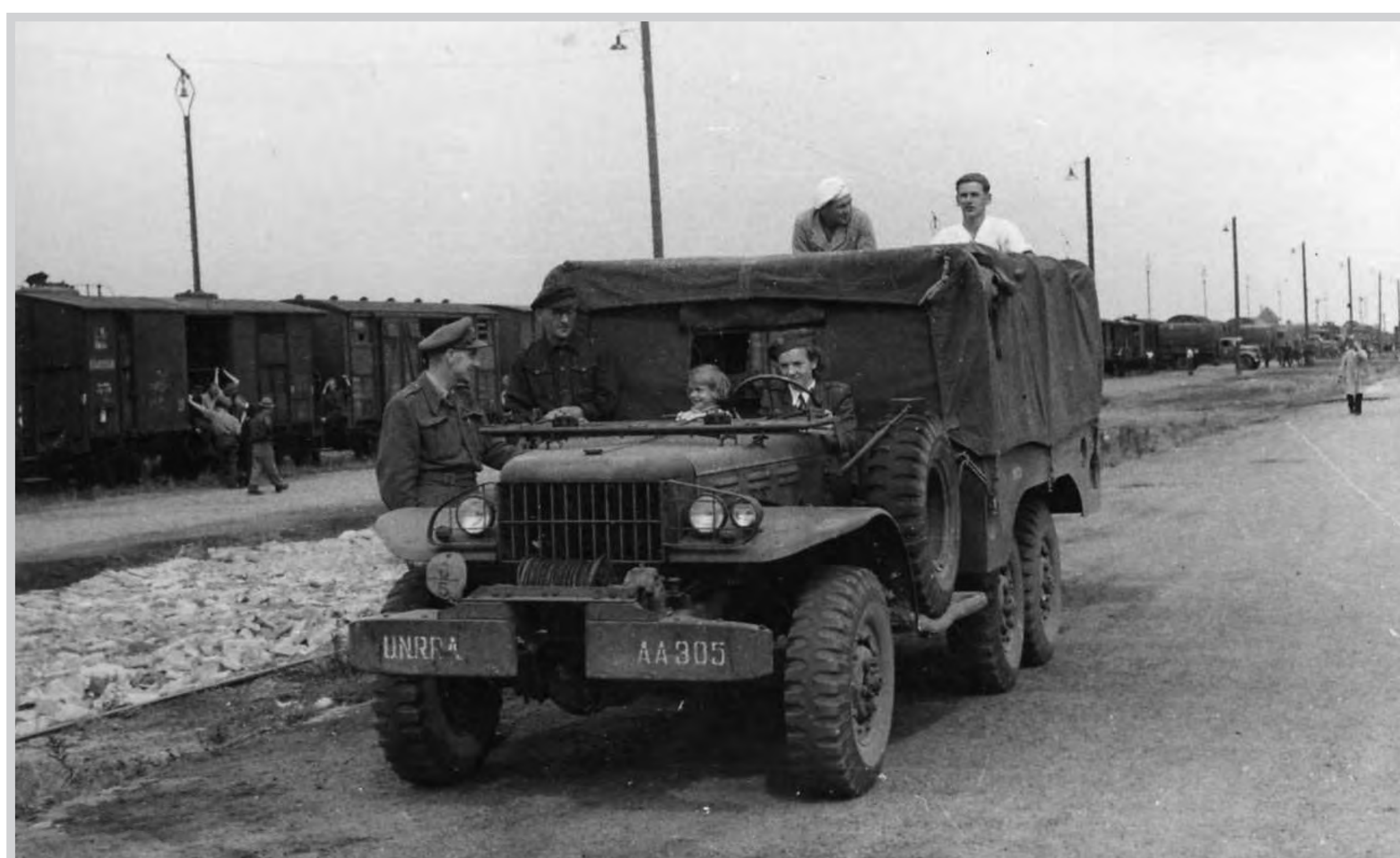
Amerikanischer Lastwagen am Bahnhof

Die Rüstungsproduktion ging einher mit der Beschäftigung von Zwangsarbeitern aus den von Deutschland besetzten Ländern und von Kriegsgefangenen. Zur Unterbringung unterhielt das Volkswagenwerk südlich des Mittellandkanals große Barackenlager.