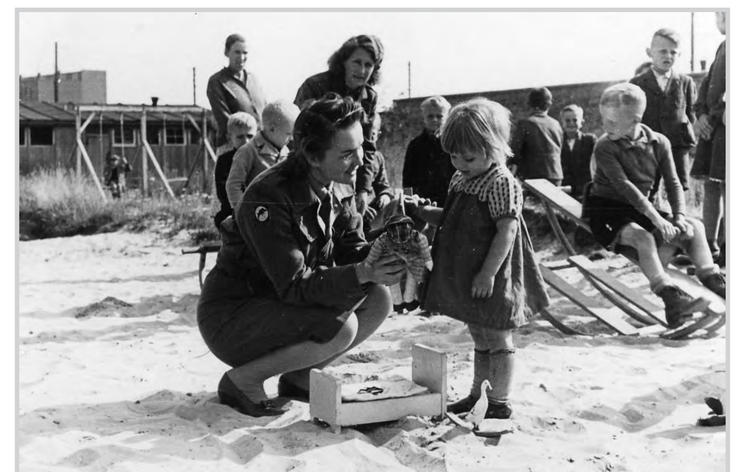
Kinder von Displaced Persons unmittelbar nach dem Krieg

Auf dem Friedhof sind auch 3 Kinder bestattet (1 holländisches, 1 ungarisches, 1 russisches). Die Stadt Wolfsburg wird die Erinnerung an das durch den Krieg verursachte Leid auch durch die Pflege der Gräber wach halten.